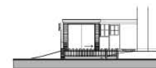
aanzicht nieuw te plaatsen schuifhek